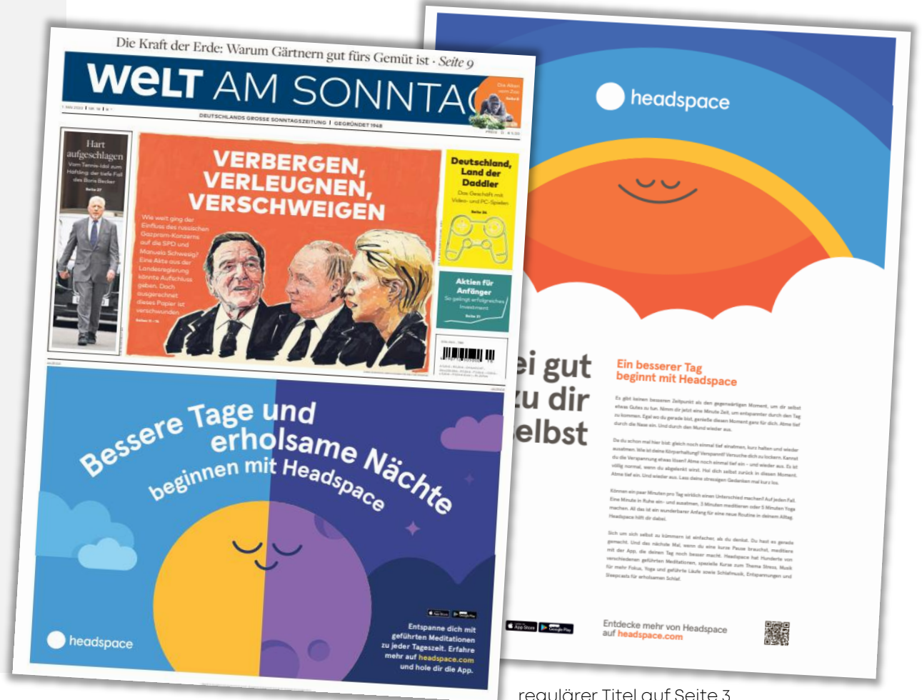
regulärer Titel auf Seite 3

Die Abnahme als Naturalrabatt ist bei dieser Werbeform ausgeschlossen. Limitierte Verfügbarkeit, nur auf Anfrage. Das Anzeigenmotiv muss vor Veröffentlichung durch den Verlag freigegeben werden. Vorlaufzeit: 4 Wochen.