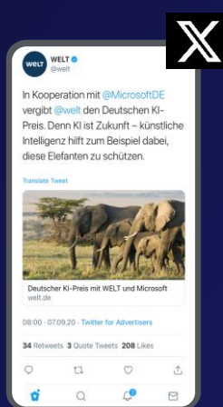
X (Twitter) Promoted Tweets