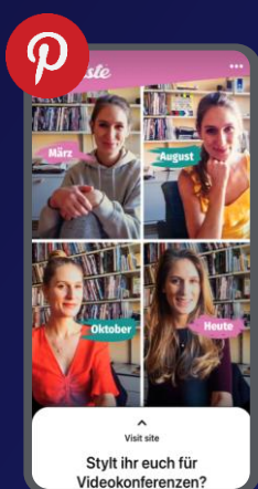
Pinterest Sponsored Posts