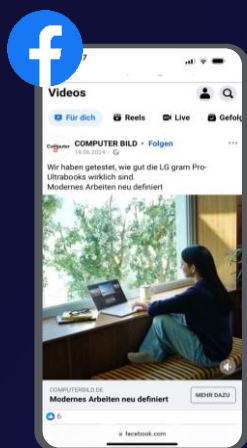
Facebook Sponsored Posts

Nicht alle unsere Medienmarken sind auf allen Social-Media-Plattformen verfügbar. Siehe Fußnoten bei den jeweiligen Social-Media-Plattformen.