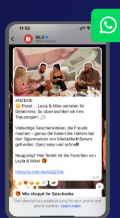
WhatsApp Posts oder Instagram Content Posts (organisch)