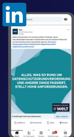
LinkedIn Sponsored Posts