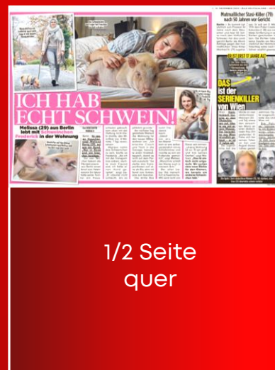
1/2 Seite quer