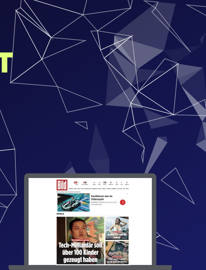
Visualisierungsbeispiel für Native Ads am Beispiel des Kunden BattleKart.

Native Teaser werden ROP über unser gesamtes Portfolio hinweg ohne Targeting ausgespielt.