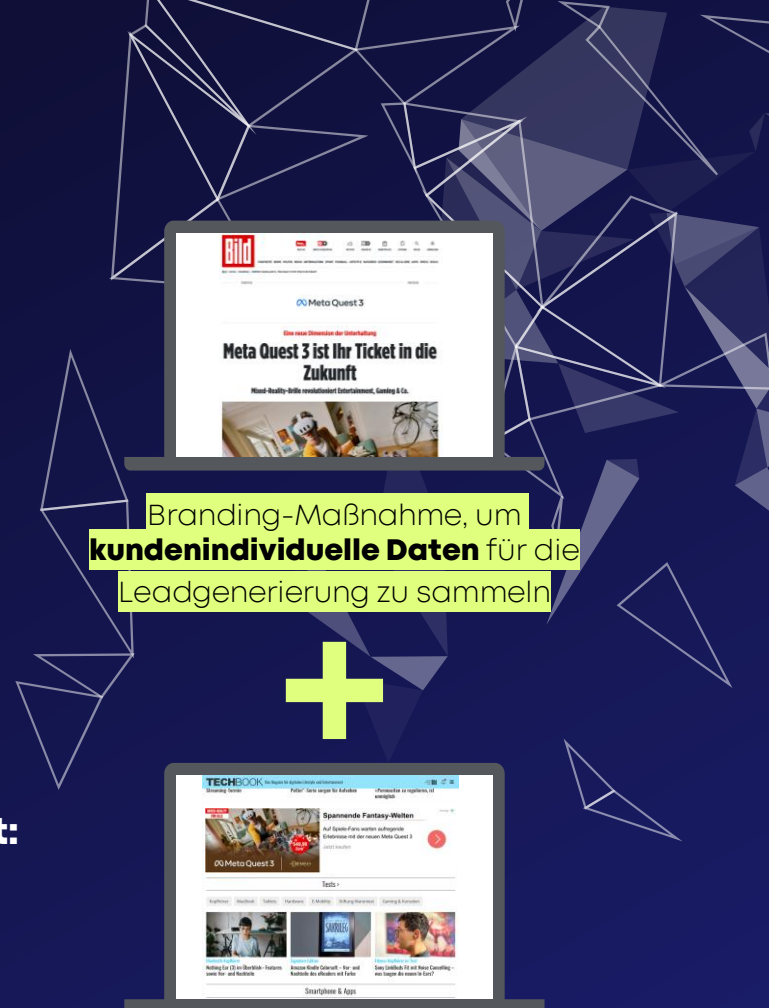
Visualisierungsbeispiel für Native Ads am Beispiel des Kunden Meta.

Interaction Add-On 4 im Media Impact Portfolio mit Verlinkung zu deiner Landingpage 2 zur Generierung messbarer Interaktionen