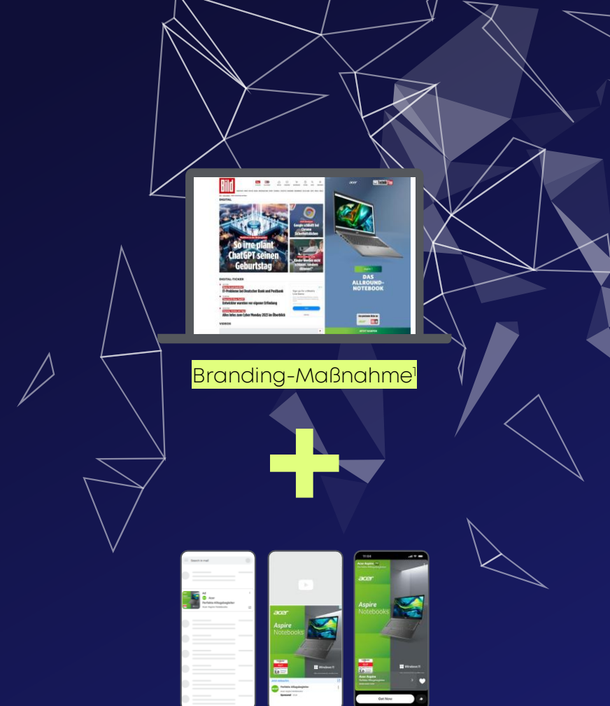
Beispielhafte Visualisierung von Acer-Werbearzeigen auf Gmail, YouTube und Snap.

Social Audience Boost 2 über alle gängigen Plattformen 3 zur Erreichung der garantierten KPIs