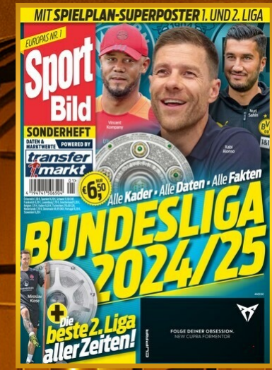
Sport BILD Print