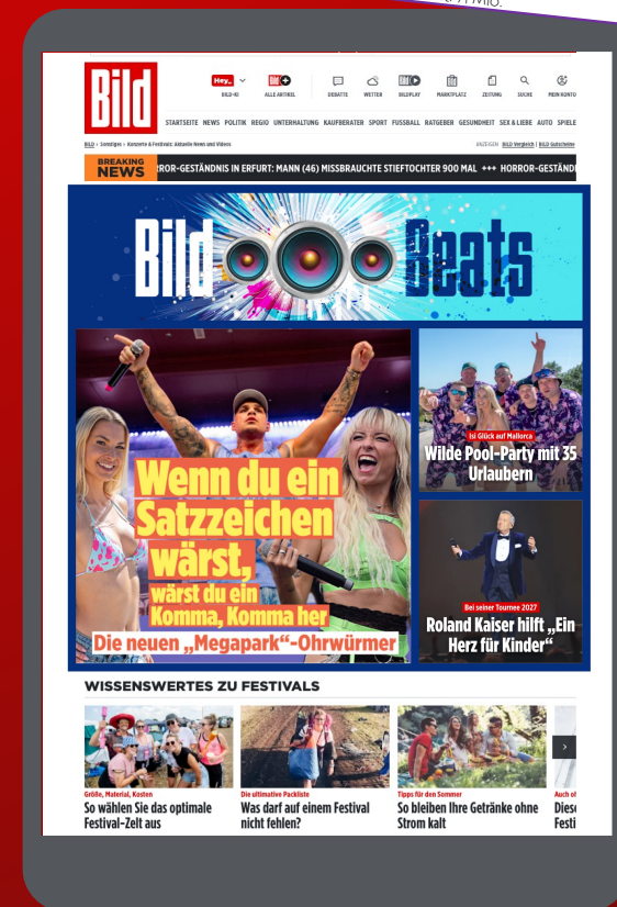
Bild MAFO-Fakt Das Format erreicht 1,7 Mio eventaffine BILD User monatlich! b4p 2025 II, Gesamt: 71 Mio.

Prominent im Unterhaltungsumfeld platziert garantiert BILD Beats ein markensicheres Umfeld und liefert mit 3 Mio. Als pro Monat eine Reichweite, die sich sehen lässt.