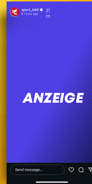
STORY Fragerunden, Highlights und vieles mehr