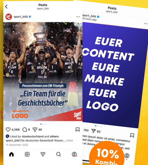
SLIDE POST Logointegration und Content Post