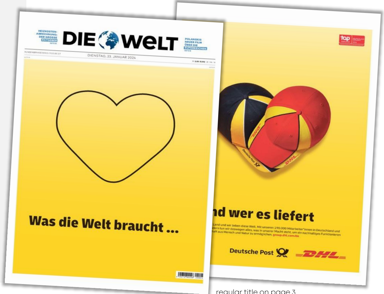
regular title on page 3

Discounts in kind are not available for this form of advertising. Limited availability, only on request. The advertisement motif must be approved by the publisher prior to publication. A barcode must be included on the front page. Lead time: 4 weeks