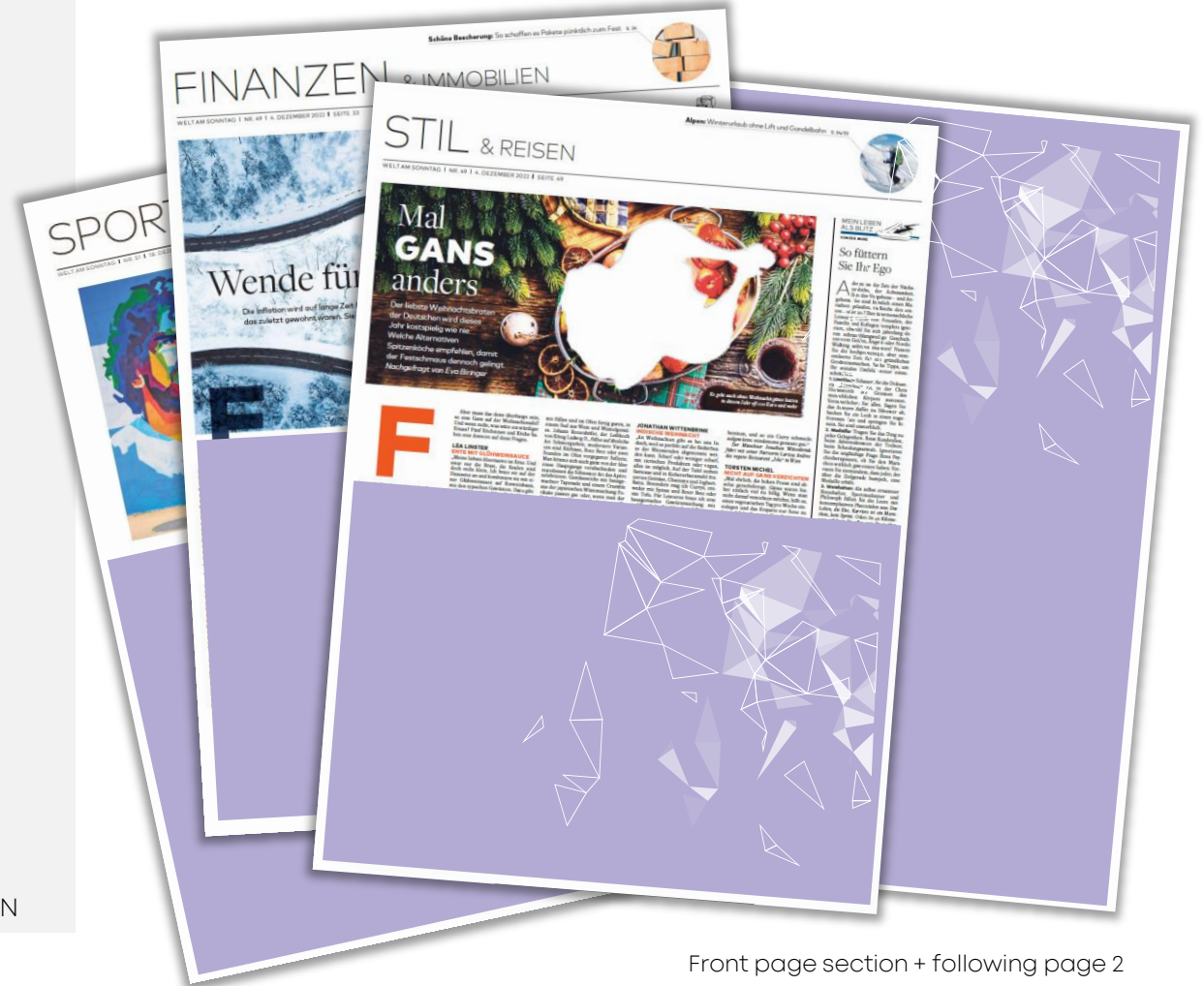
Front page section + following page 2