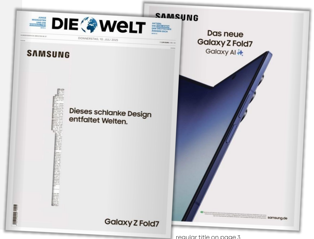
regular title on page 3

For prices and formats, see Title Branding XXL.