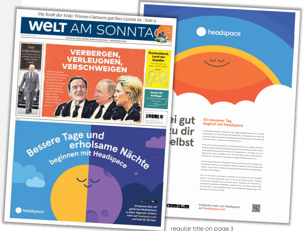
regular title on page 3

Discounts in kind are not available for this form of advertising. Limited availability, only on request. The advertisement motif must be approved by the publisher prior to publication. Lead time: 4 weeks.