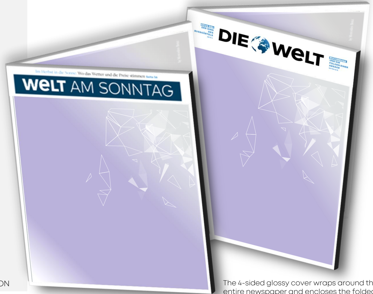
The 4-sided glossy cover wraps around the entire newspaper and encloses the folded newspaper.