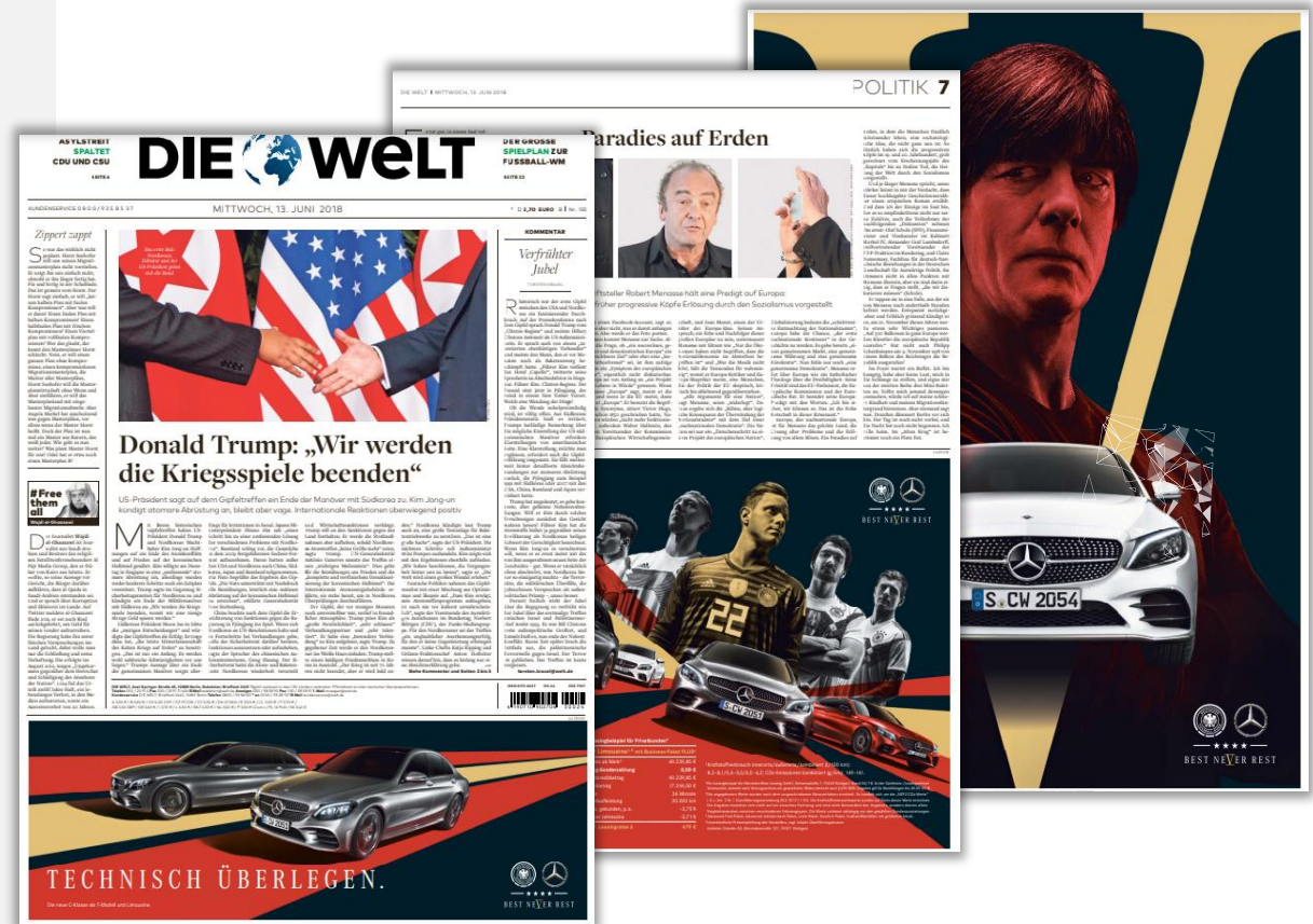
CASE: MERCEDES EVOLUTION AD MINI, 13./17.06.2018