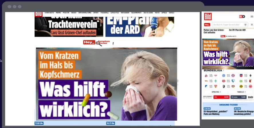
BILD Homepage Teaser

Auf der BILD-Homepage findet der User für insgesamt 24 Stunden* einen großen, gut sichtbaren Teaser, der direkt auf Ihren Symptomchecker verlinkt .