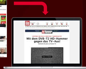
BILD.DE MULTI-SCREEN ADVERTORIAL