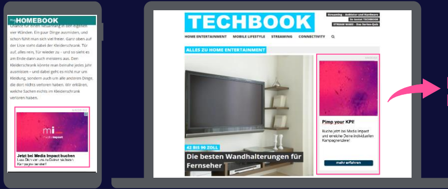
BILD UND/ODER VIDEO NATIVE ADS