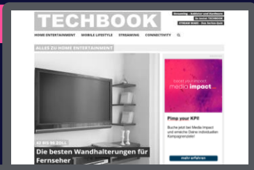
NATIVE ROP MEDIA IMPACT