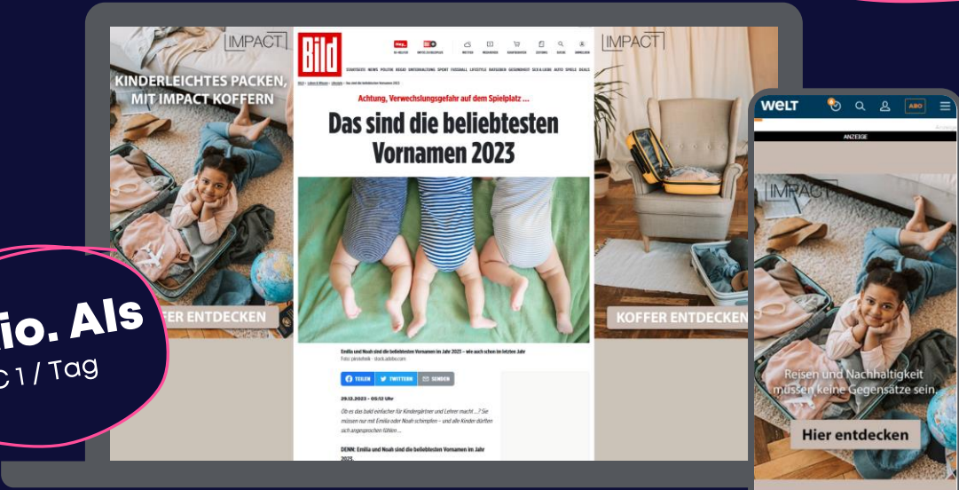
Für Preview bitte klicken