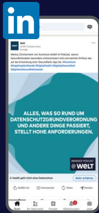
LinkedIn Sponsored Posts