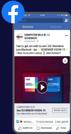
Facebook Sponsored Posts