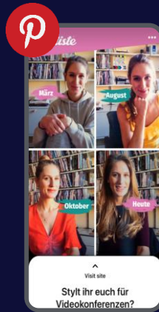
Pinterest Sponsored Posts