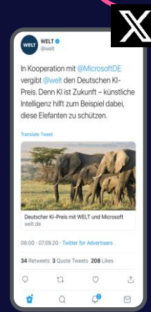
X (Twitter) Promoted Tweets