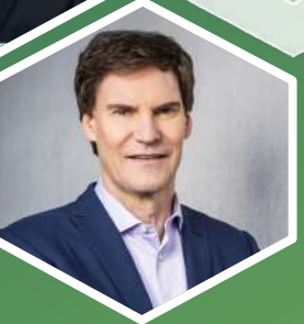
Carsten Maschmeyer, Investor