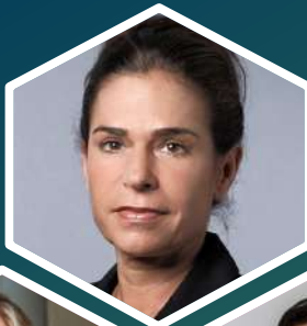
Markus Duesmann Vorstands- vorsitzender AUDI