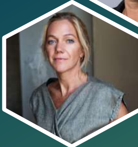
Maja Lunde, Bestsellerautorin