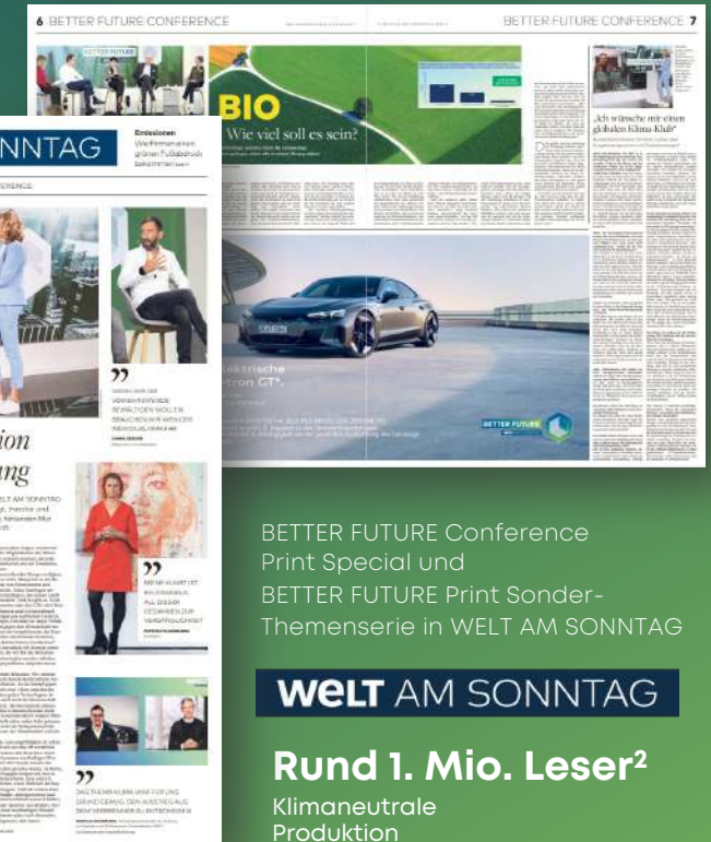
BETTER FUTURE Conference Print Special und BETTER FUTURE Print Sonder-Themenserie in WELT AM SONNTAG