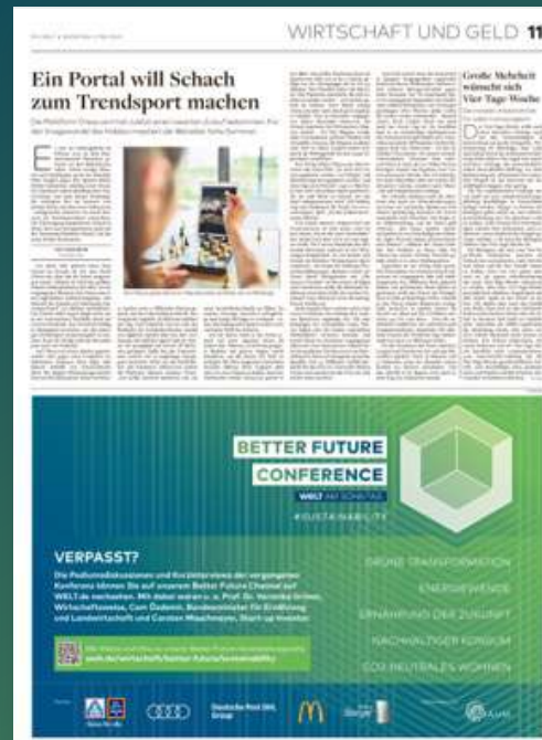
EIGENANZEIGEN BEI WELT