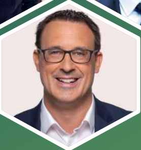
Sören Bartol, Parlamentarischer Staatssekretär bei der Bundesministerin für Wohnen, Stadtentwicklung und Bauwesen