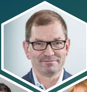
Markus Duesmann Vorstands- vorsitzender AUDI