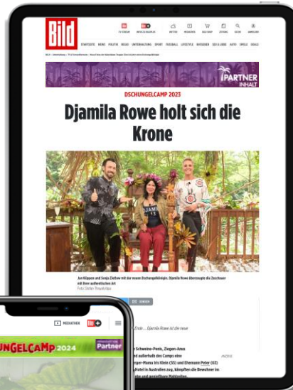
Artikel: Sponsoring Header

BILD Homepage exklusive Logo Integration im redaktionellen Block