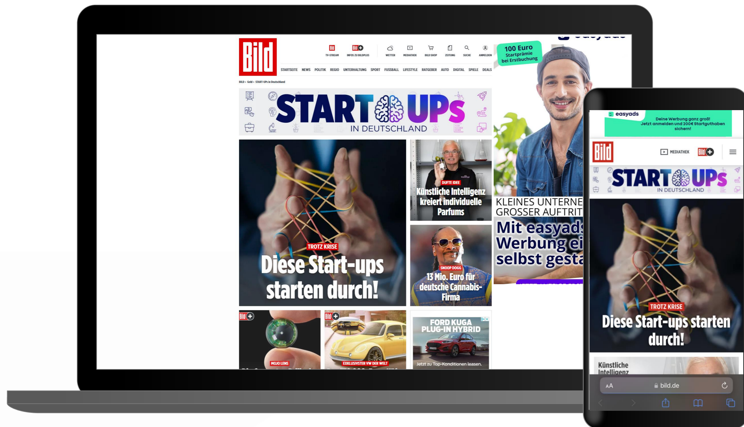
BILD SPECIAL START-UPS

Unsere Start-Up affinen Leser finden sich auf dem Themenspecial „Start Ups für Deutschland“ wieder.