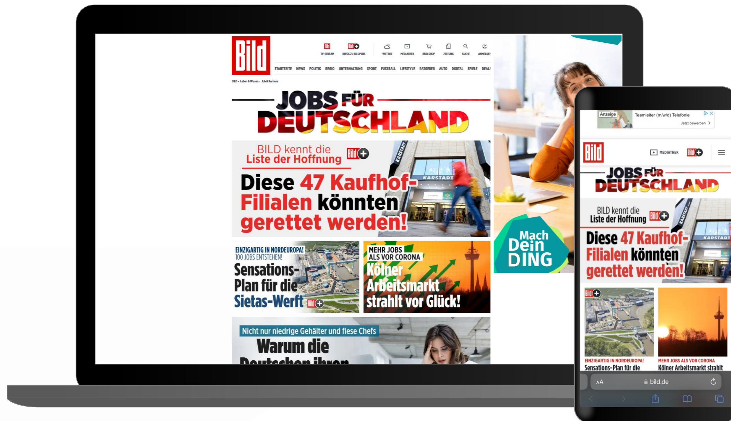
BILD SPECIAL RECRUITING