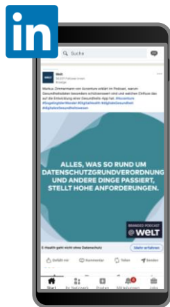
LinkedIn Sponsored Posts