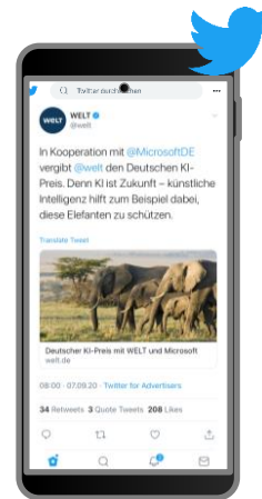
Twitter Promoted Tweets