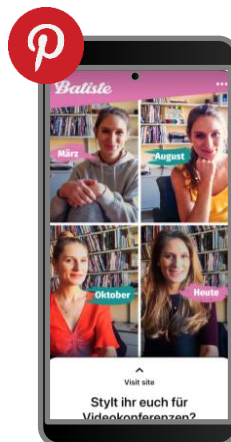
Pinterest Sponsored Posts