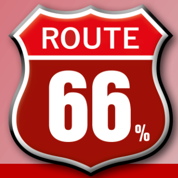
BILD am SONNTAG nimmt Sie mit auf eine unvergessliche Spar-Route!

Nutzen Sie die einmalige Mitspar-Gelegenheit und sichern Sie sich 66% Cashrabatt bei Buchung einer 1/1 Seite.