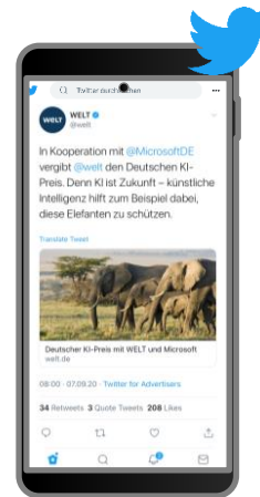
Twitter Promoted Tweets