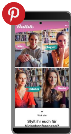
Pinterest Sponsored Posts