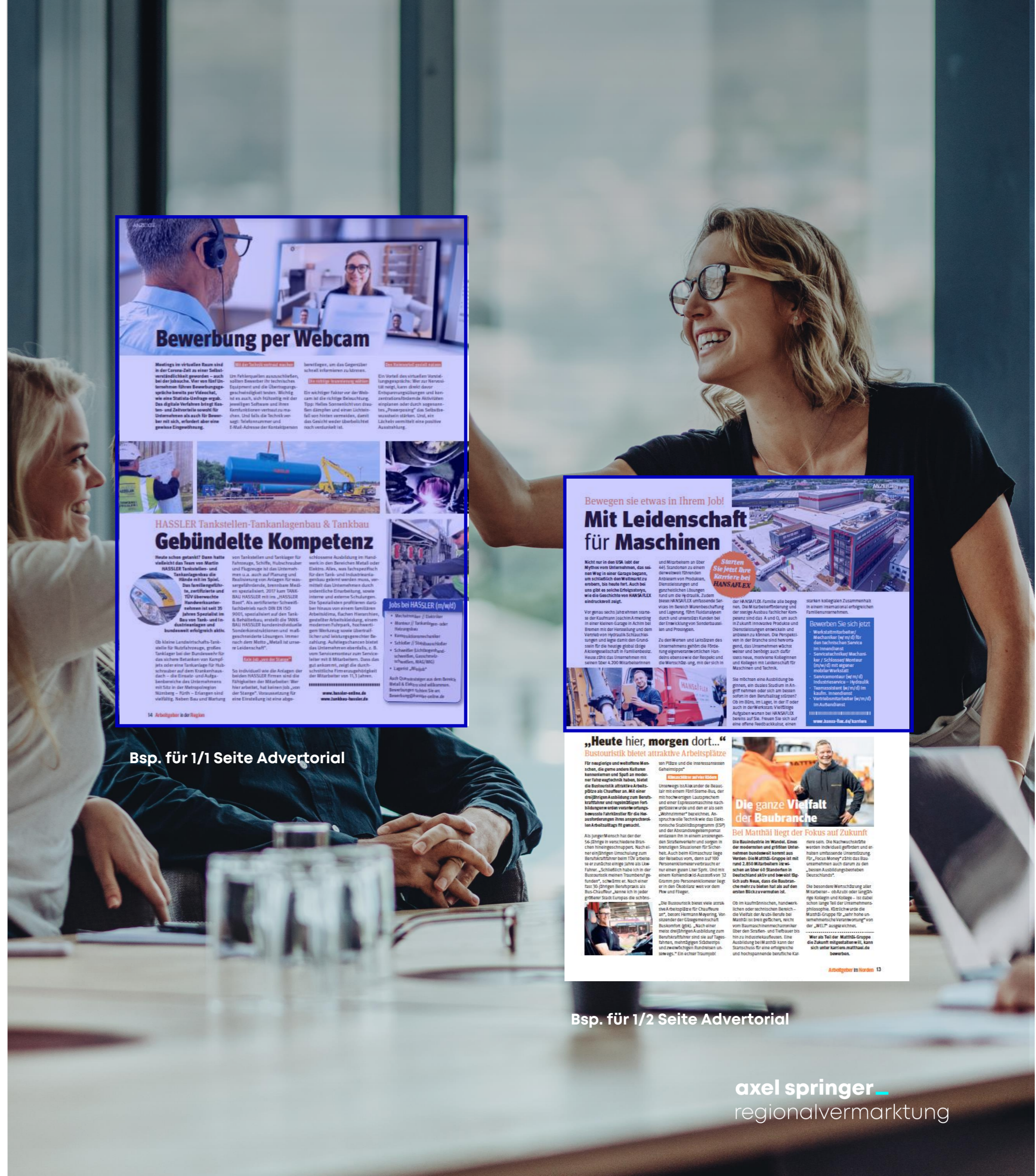
Bsp. für 1/2 Seite Advertorial