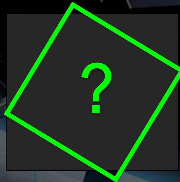
EIN VERTRETER IHRER MARKE