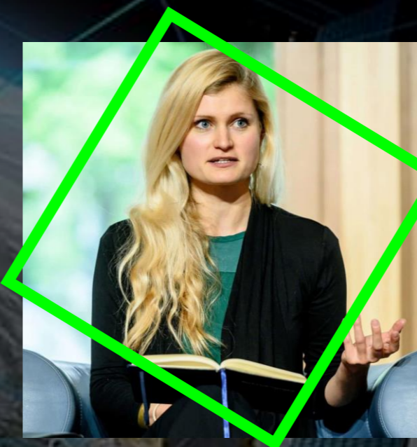
ULRIKE FRANKE European Council on Foreign Relations