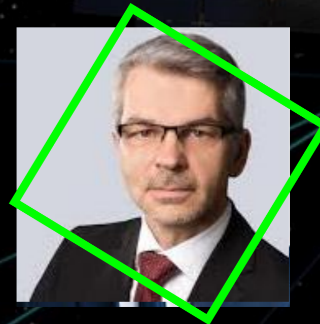
PROF. CARLO MASALA Politikwissenschaftler