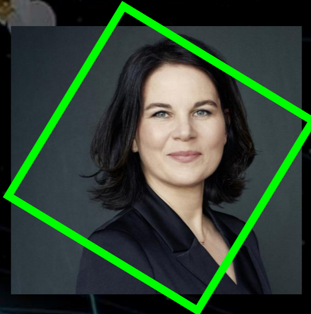
ANNALENA BAERBOCK Bundesvorsitzende BÜNDNIS 90/ DIE GRÜNEN