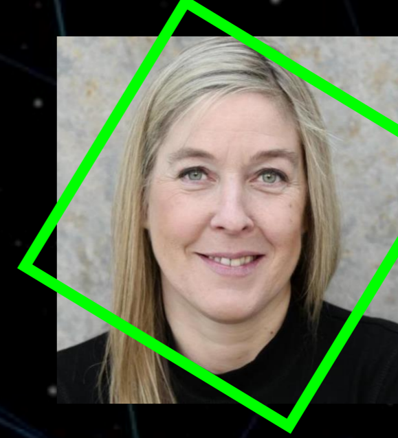
CONSTANZE KURZ Informatikerin, Autorin und Sprecherin des Chaos Computer Clubs