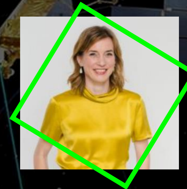
SIEMTJE MÖLLER Mitglied des Deutschen Bundestages, verteidigungspolitische Sprecherin der SPD