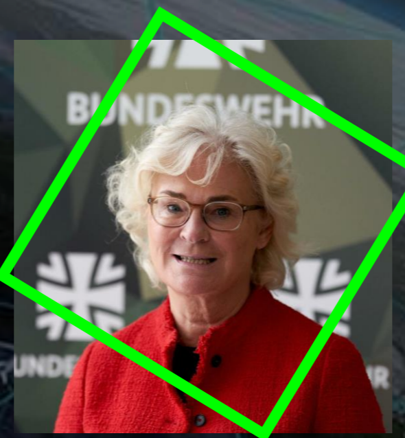
Christine Lambrecht Bundesministerin der Verteidigung