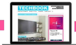
NATIVE ROP MEDIA IMPACT