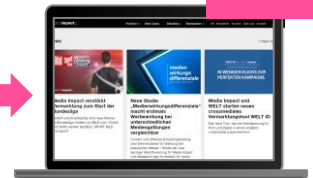
IHRE LANDING PAGE