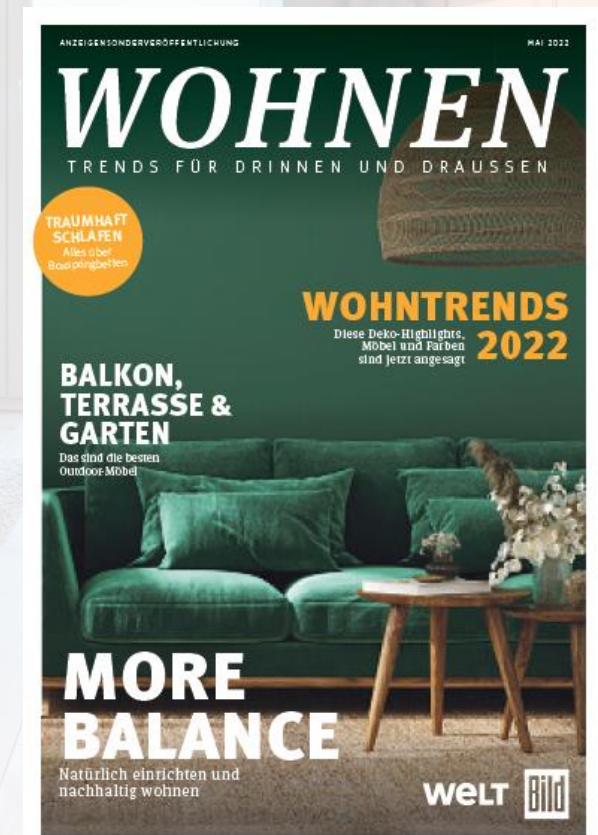
Cover Wohnen Dummy

In hochwertiger redaktioneller Aufmachung sprechen Sie mit Ihrer Anzeige in diesem Umfeld bis zu 1,32 Mio. Leserinnen und Leser und insgesamt bis zu 8,86 Mio. Nutzerinnen und Nutzer crossmedial an und liefern Inspiration für die eigenen vier Wände!