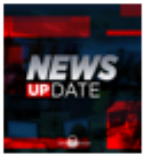
BILD NEWS UPDATE

Zweimal täglich die aktuellsten Nachrichten aus den Bereichen News, Wirtschaft, Politik, Show, Sport und Promis - mit BILD immer bestens informiert!