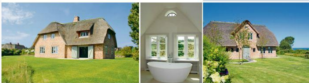
Verkleinerte Darstellung der Exposé-Anzeige