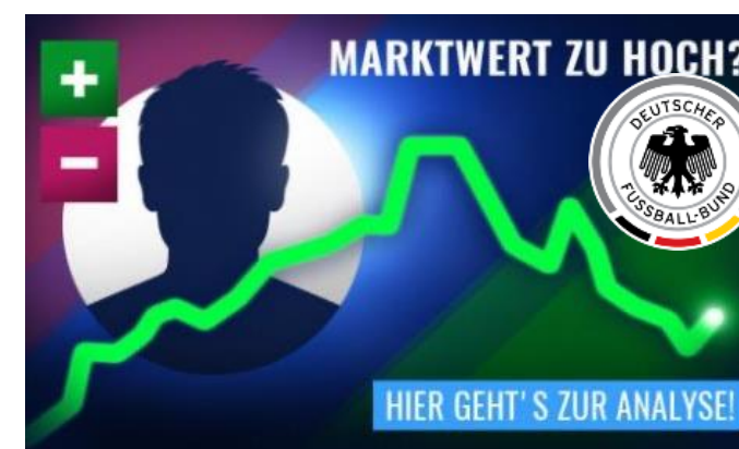
DETAILS & FACHWISSEN