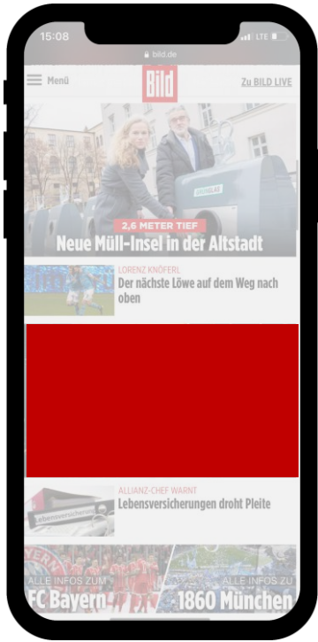
Mobile A-Teaser (Content Ad 2:1)