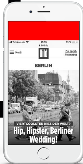
Mobile Content Ad 4:1