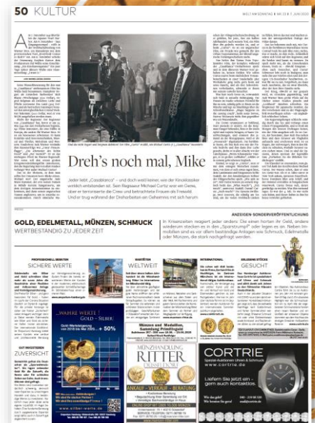
Umsetzung Juni 2020 „Gold, Edelmetall, Münzen, Schmuck“