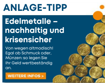
Animiert, Sequenz 1