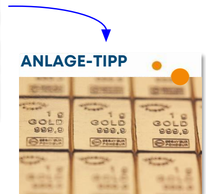
Animiert, Sequenz 2