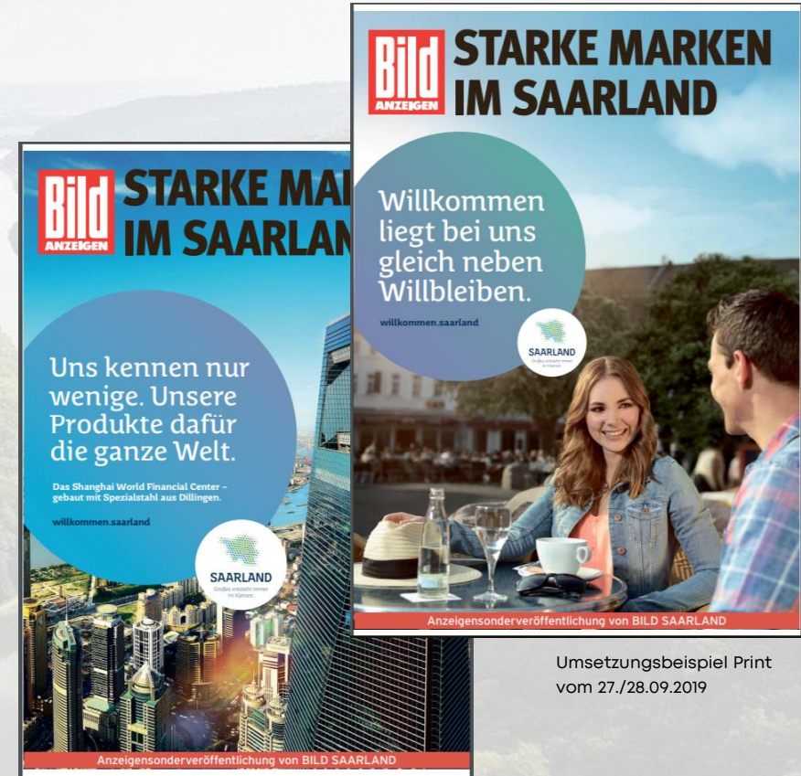
Umsetzungsbeispiel Print vom 27./28.09.2019

Ihre Print-Anzeige wird automatisch auf Bild.de* digital verlängert!