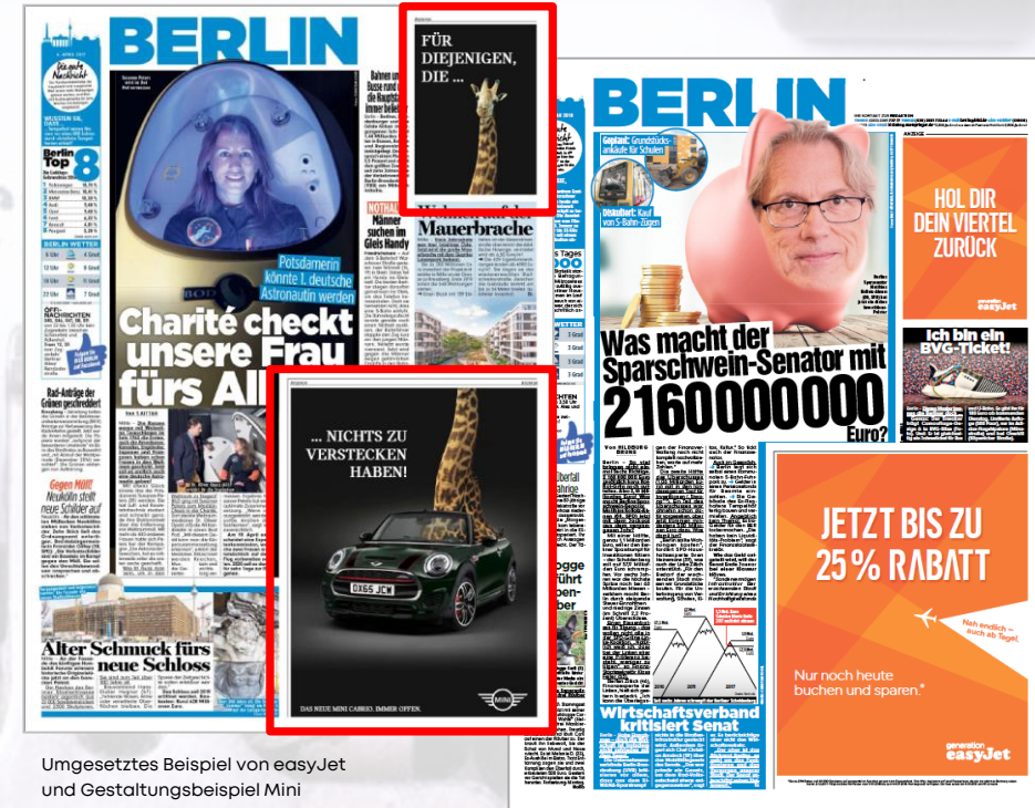
Umgesetztes Beispiel von easyJet und Gestaltungsbeispiel Mini