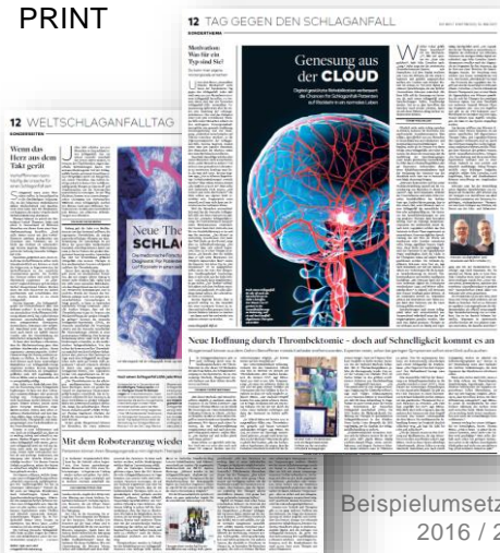
Beispielumsetzung 2016 / 2017