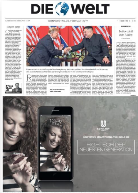
½ Seite - Titelseite WELT Print Werktag

1 Limitierte Verfügbarkeit - nach Freigabe der Chefredaktion