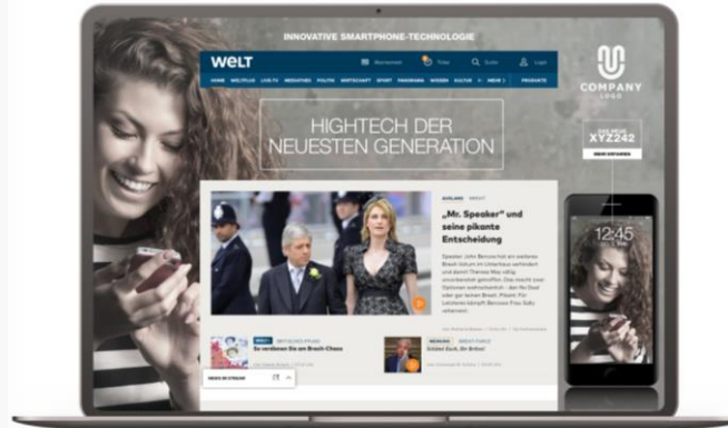
TakeOverAd WELT.de (stationär)