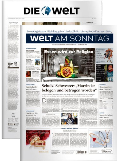
Auflage in Tsd. (IVW Q1 2019)