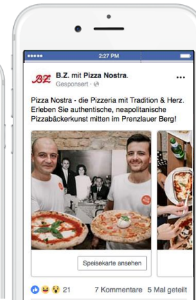
CAROUSEL AD Bis zu 5 rotierende Visuals, verschiedene Verlinkungen möglich