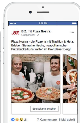
CAROUSEL AD Bis zu 5 rotierende Visuals, verschiedene Verlinkungen möglich