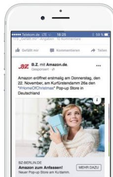
DER KLASSIKER Ein Visual mit Verlinkung auf Kundenseite