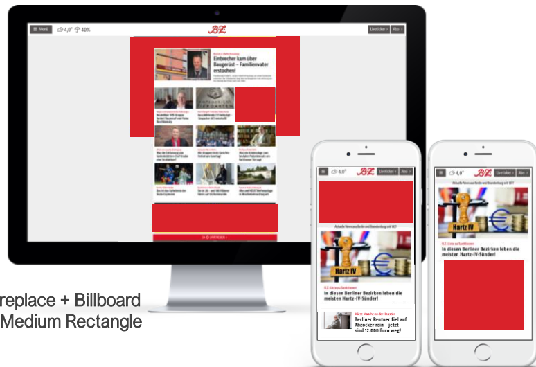
Fireplace + Billboard + Medium Rectangle