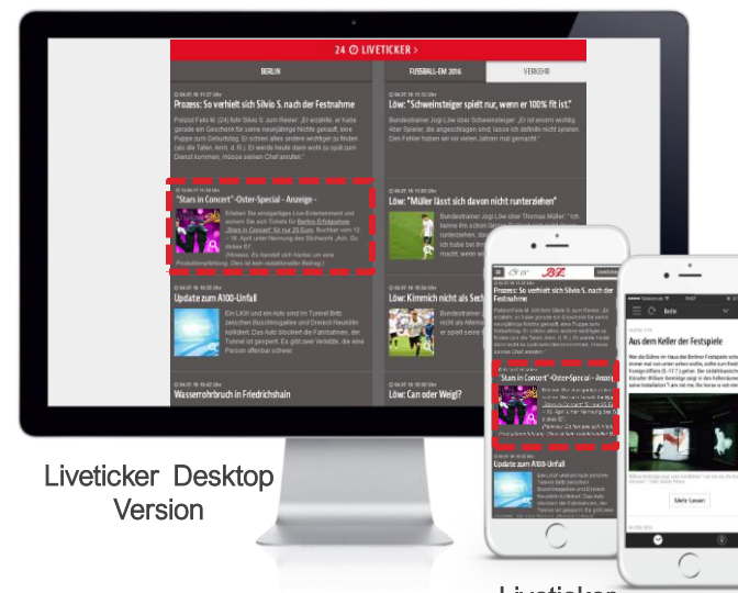
Liveticker Desktop Version