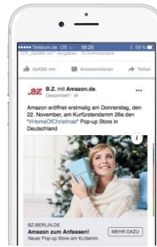
DER KLASSIKER Ein Visual mit Verlinkung auf Kundenseite