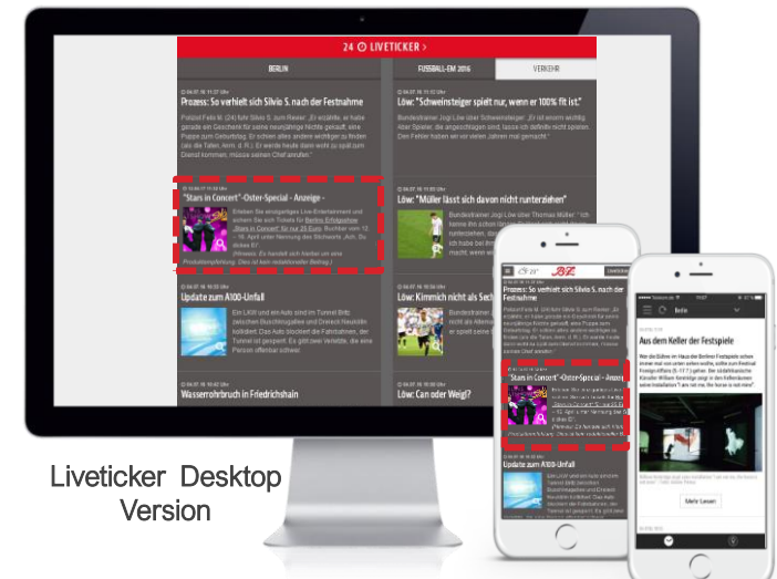
Liveticker Desktop Version