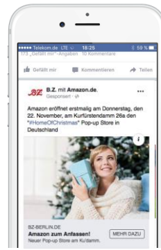
DER KLASSIKER Ein Visual mit Verlinkung auf Kundenseite