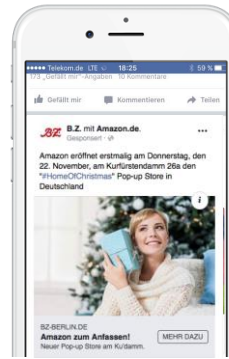
DER KLASSIKER Ein Visual mit Verlinkung auf Kundenseite