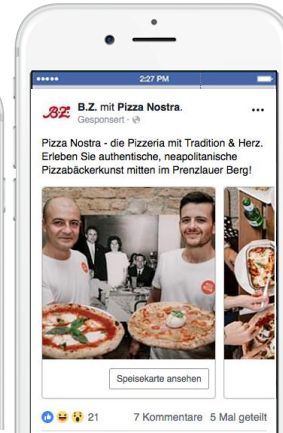
CAROUSEL AD Bis zu 5 rotierende Visuals, verschiedene Verlinkungen möglich