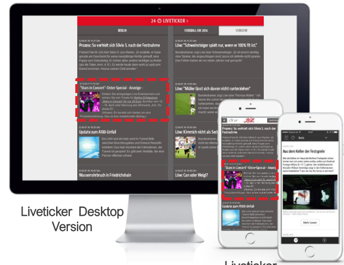
Liveticker Desktop Version