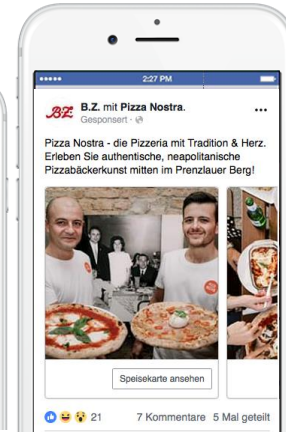
CAROUSEL AD Bis zu 5 rotierende Visuals, verschiedene Verlinkungen möglich