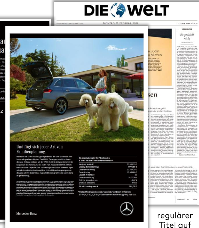
letzte Seite: U4 Titelseite mit Glanz-Branding