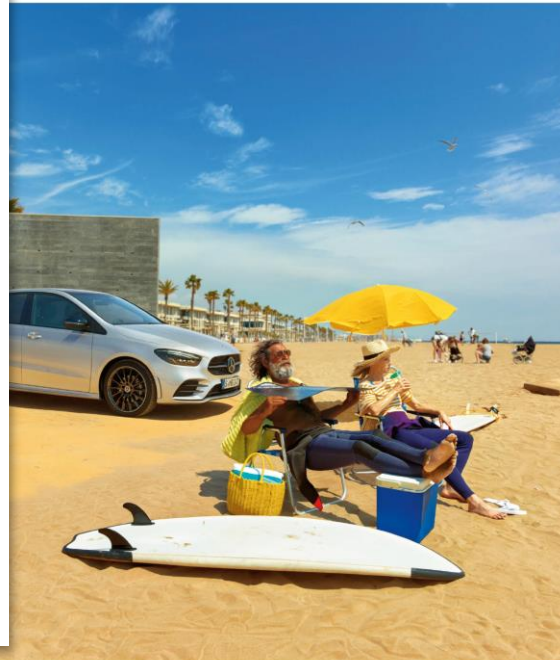
Seite 3: U2 Panorama-Seite + U3 mit Glanz-Branding