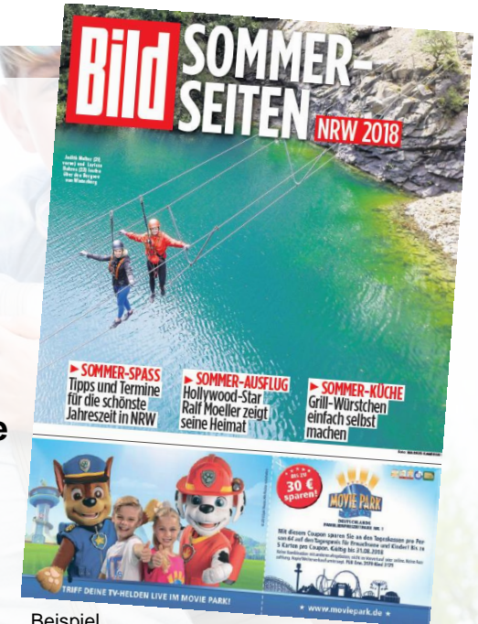
Beispiel Sommer-Seiten 2018

Gerne beraten wir Sie zu besonderen Themen und Anzeigenformaten!