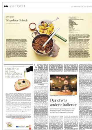
Eckfeld, 2sp., Hochformat

Die Preise verstehen sich als Ergänzung der Preisliste WELT Nr. 97a, gültig ab 01.01.2019.