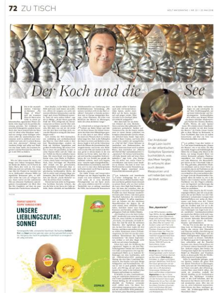
Bsp.: dreispaltiges Eckfeld