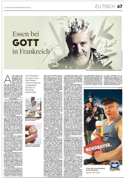
Bsp.: zweispaltiges Eckfeld Hochformat