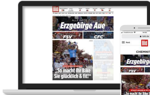
A-Teaser auf dem Regio Channel