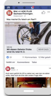
Sponsored Post auf Facebook