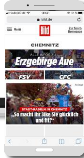
Mobiler A-Teaser auf dem Regio Channel