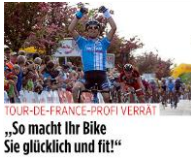
Medium in RoS