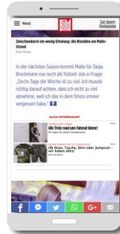
Ausspielung als Artikel Empfehlung mit Regiotargeting