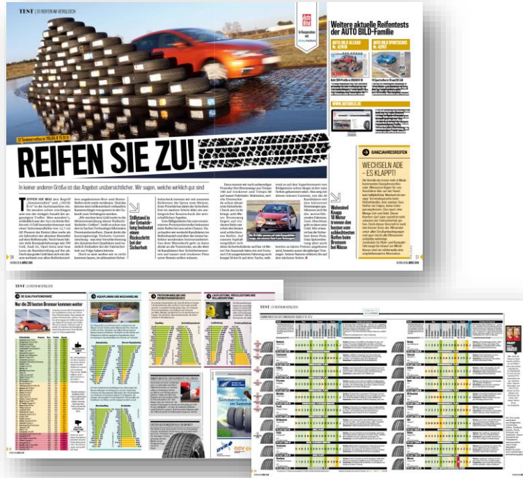
Bsp. Sommerreifentest 2018