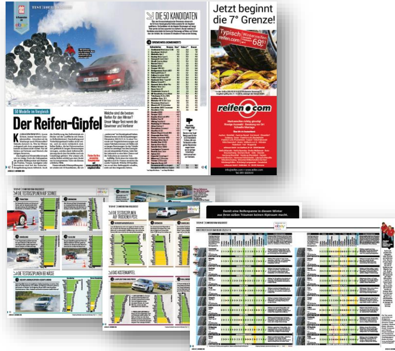
Bsp. Winterreifentest 2018

Ganzjahres-/Winterreifentest plus Zusammenfassung