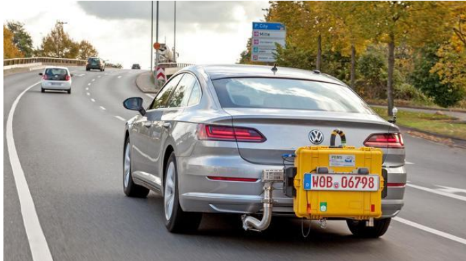
Ein VW-Arteon fährt mit einem mobilen Testgerät während einem WLTP-Abgastest auf einer Straße.

Seit dem 1. September gelten in der EU neue Verbrauchsnormen für Autos. Wie viel Sprit ein Auto verbrennt, wird zukünftig nicht mehr nach dem 1997 eingeführten NEFT-Prüfverfahren gemessen, sondern nach WLTP.