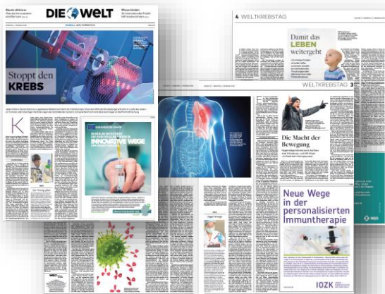
Umsetzung „Weltkrebstag“ DIE WELT März 2018